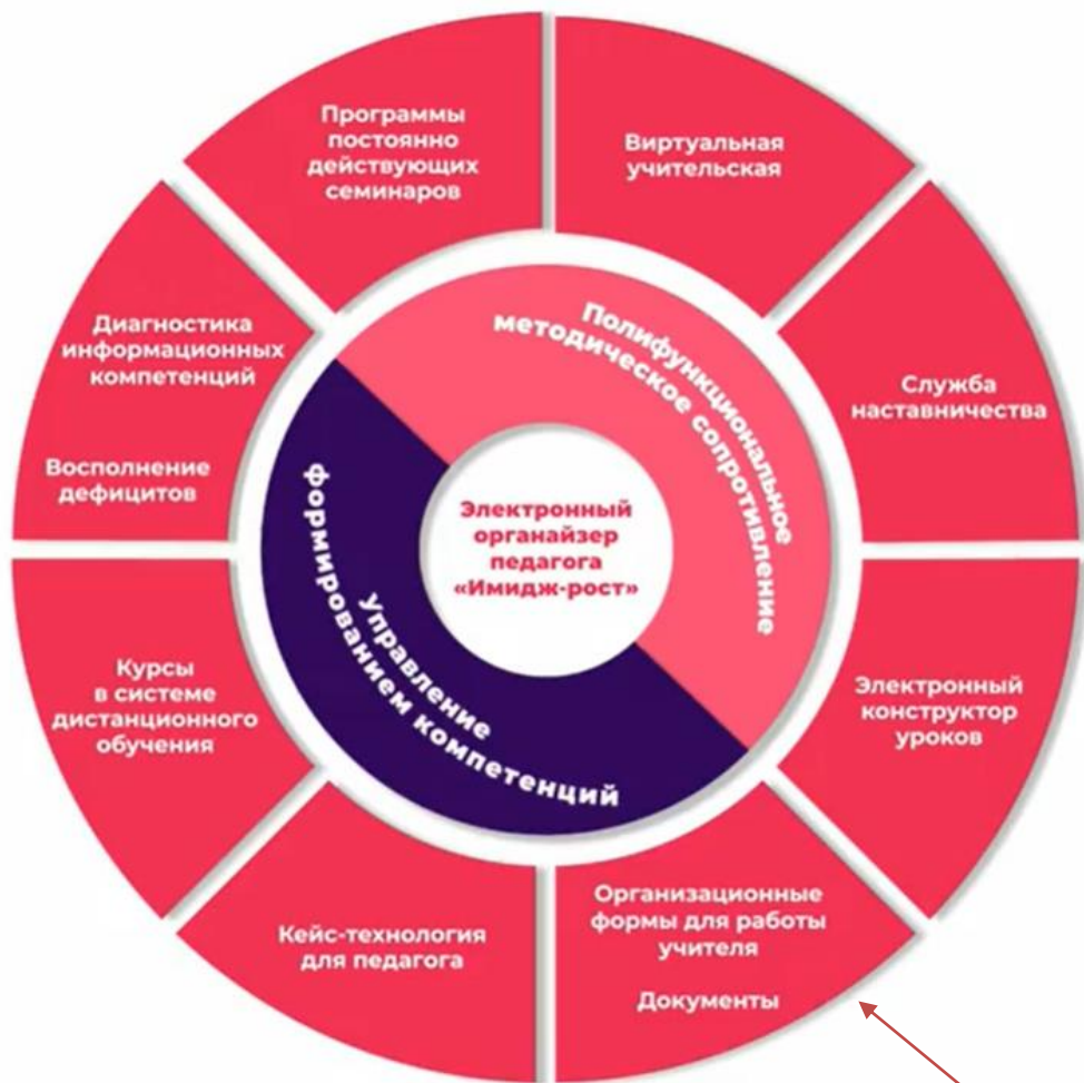
электронная модель внутришкольной системы непрерывного профессионального развития педагога «Имидж-рост»